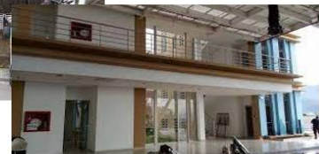
Aeropuerto de Ibagué