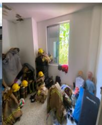
Aeropuerto de Neiva